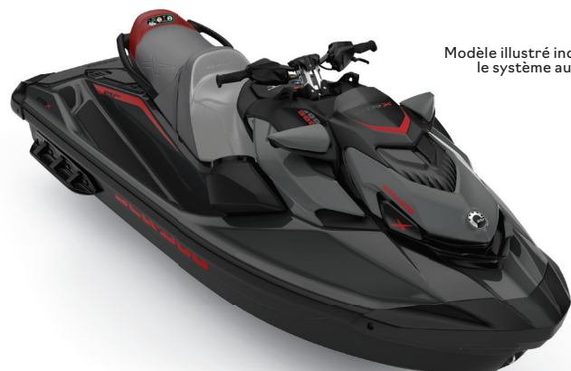
Modèle illustré inclut le système audio

NOUVEAU Noir éclipse et Marsala métallique